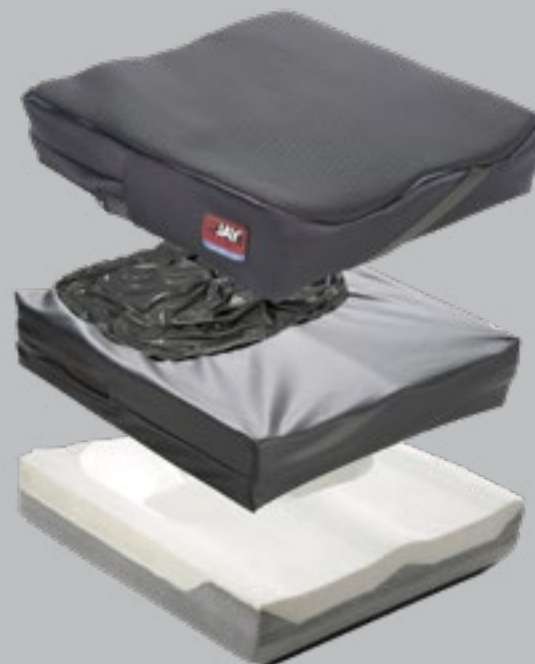
JAY Balance mit Cryo Fluid

Für mehr Schutz und zur Unterstützung eines optimalen Wärme- und Feuchtigkeitstransport besteht das Balance Rollstuhlkissen aus einem inneren, wasserundurchlässigen Bezug sowie aus einem äusseren mikroklimatischen Bezug. Wahlweise kann auch ein Stretch-Bezug (Scherkraftreduzierung) oder ein Inkontinenzbezug bestellt werden.